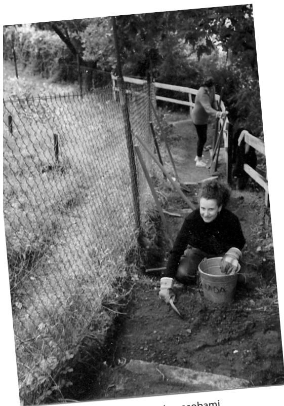
Oczyszczanie ścieżek na obozie z osobami niepełnosprawnymi w Pradze, Czechy