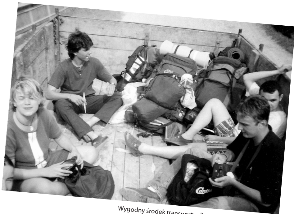
Wygodny środek transportu dla wolontariuszy na obozie, Suceava, Rumunia