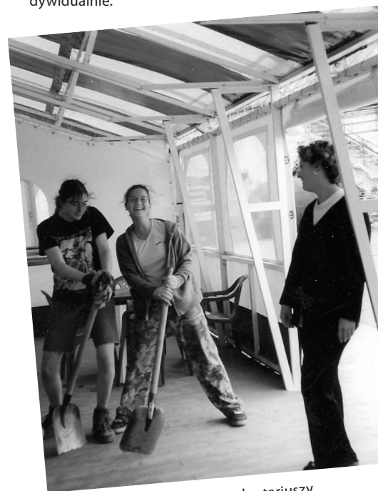
Chwila odpoczynku, obóz wolontariuszy w St. Petersburgu, Rosja