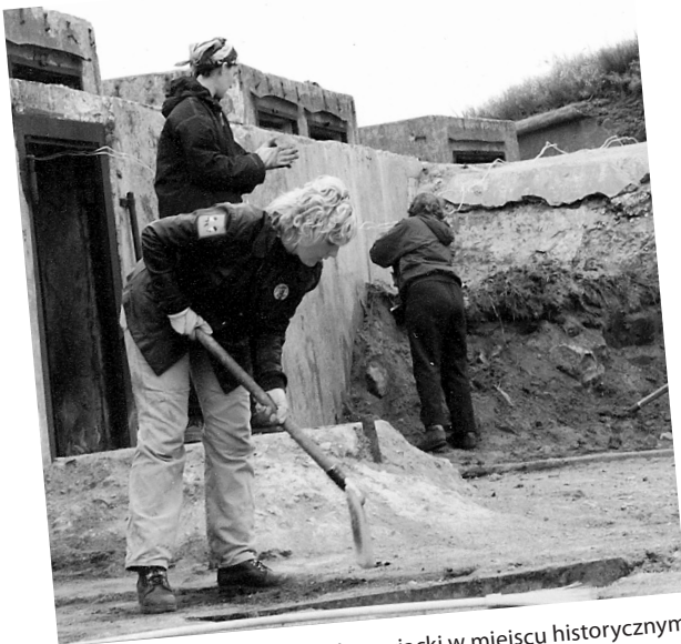
Obóz wolontariacki w miejscu historycznym, St. Petersburg, Rosja

W języku polskim nie przyjęło się bezpośrednio tłumaczyć angielskiego terminu workcamp (dosł.: obóz pracy), co wynika z historycznych skojarzeń. Jednak charakterystycznym elementem obozu wolontariackiego pozostaje świadczona przez wolontariuszy praca.