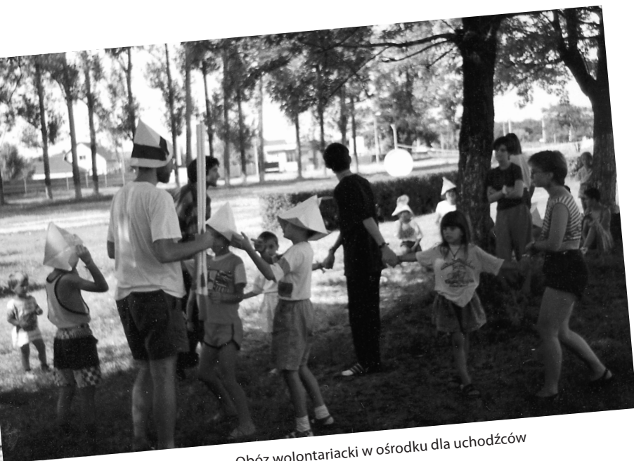
Obóz wolontariacki w ośrodku dla uchodźców w Debrecen, Węgry