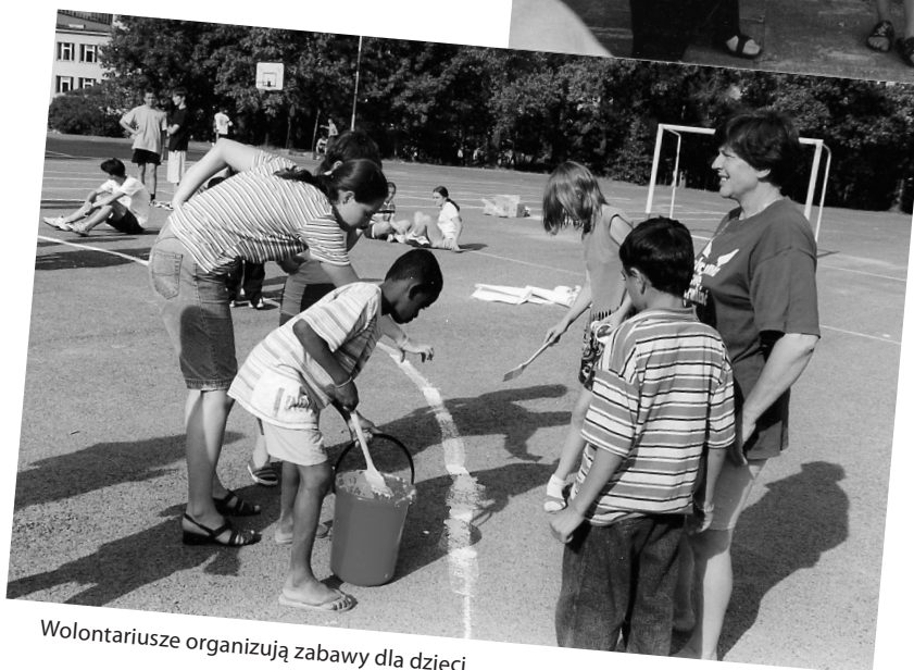
Wolontariusze organizują zabawy dla dzieci uchodźców w Polsce